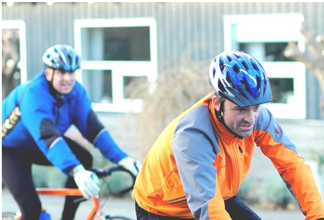
Gorm i front ved dette års sponsorløb til fordel for Projekt Kirgistan