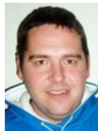
Anders Havreballe Højskolen efterår 2006 Pædagog, Vejle