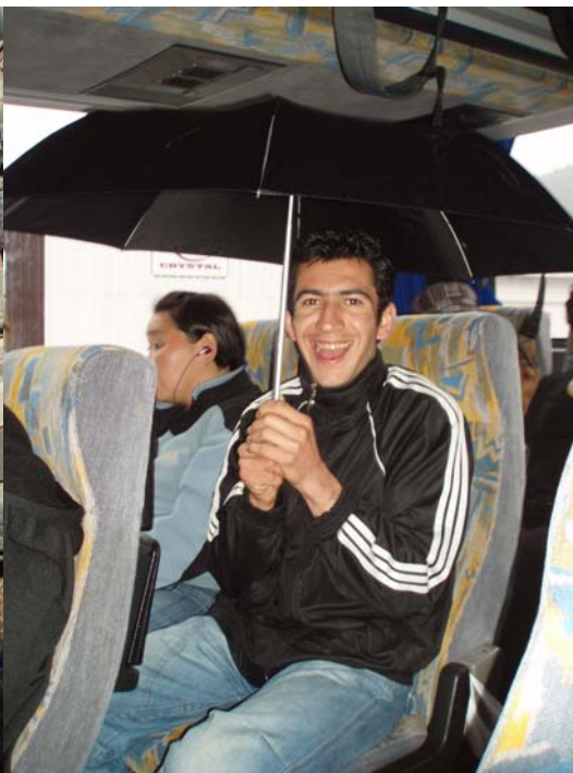
Selvom vejret ikke var så godt, havde vi det sjovt hele tiden!