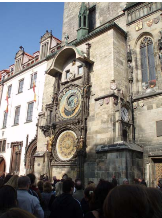
I Prags centrum er der en statue af Jan Hus. Ved siden af pladsen er der et meget berømt astronomisk ur. Hver time kan man se små figurer af de tolv apostle der bevæger sig imens uret slår.

Vi slutter af i Dresden med at gå ud at spise alle sammen. Da vi bliver færdige, kører vi mod Rønde igen. Efter 12 timer, kan vi komme ned i vores egne senge. Det er sjældent, man kan blive så glad for en seng.