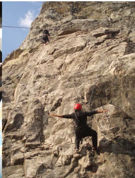
Sidste dag var vejret rigtig fint og vi prøvede en lille smule river-rafting og klatring. Kun de modigste nåede til toppen!