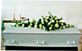
Pyntet kiste til kristen begravelse

I det kristne ritual bliver man begravet eller brændt.