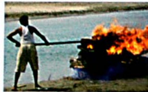
Traditionel hinduistisk kremation

Hinduerne brænder deres døde. Derefter spredes asken – helst i den hellige Gangesflod, da chancen for at få en god genfødsel så er større. I hinduismen har kroppen ingen betydning. Derimod skal sjælen leve videre i en ny krop, fordi hinduerne tror på reinkarnation 2 . Sjælen bliver sat fri, når kroppen brændes.