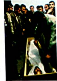
Muslimsk begravelse i Danmark

Når en muslim dør, bliver kroppen vasket og begravet med ansigtet vendt mod Mekka, som er muslimernes helligste sted. Muslimer opfatter livet som en gave fra Allah, og ved døden gøres menneskets liv op ved en slags dommedag 3 . Det vigtigste er, at man har levet sit liv på en god og ansvarsfuld måde, hvilket vil sige, at man har været en god og lydlig muslim ved at overholde Koranens love og regler.