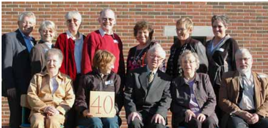
65-, 60-, 50- og 40-års-jubilarer