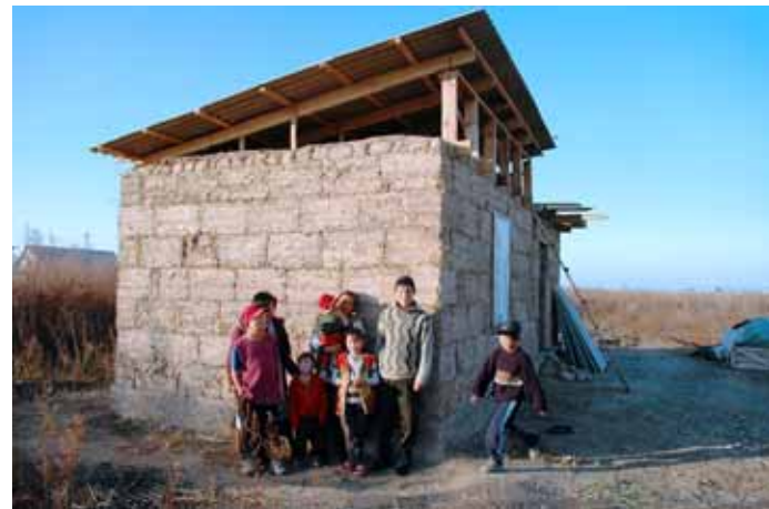
Mor med syv børn