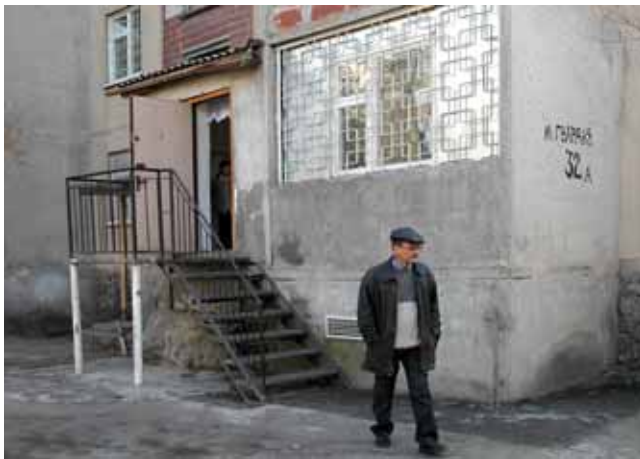
Lejlighed, hvor der gives mad, undervisning og lægetjek

Sammen med mennesker fra Centre for Protection of Children, CPC, har vi været med i byens gadebørns-liv: