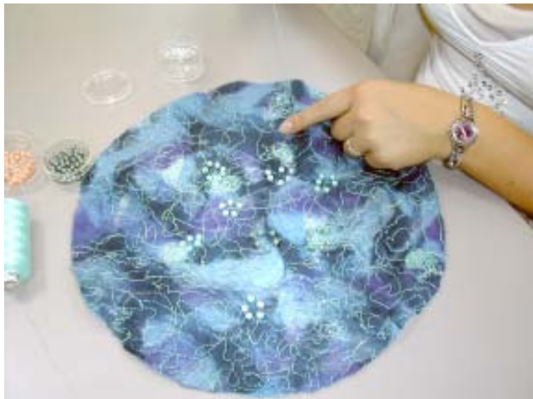
Filterne kan udformes og dekoreres og finder anvendelse i mange produkter

Ved fremstilling af materialet bruges et stykke let stof i gaze, bomuld eller silke, herpå lægges et tyndt eller tykt lag uld, ulden lægges på i vandrette og lodrette linjer, hvorved ulden trækker sig ensartet sammen. Uld og stof filtes sammen med sæbevand, og i løbet af kort tid har vi det flotte stykke stof.